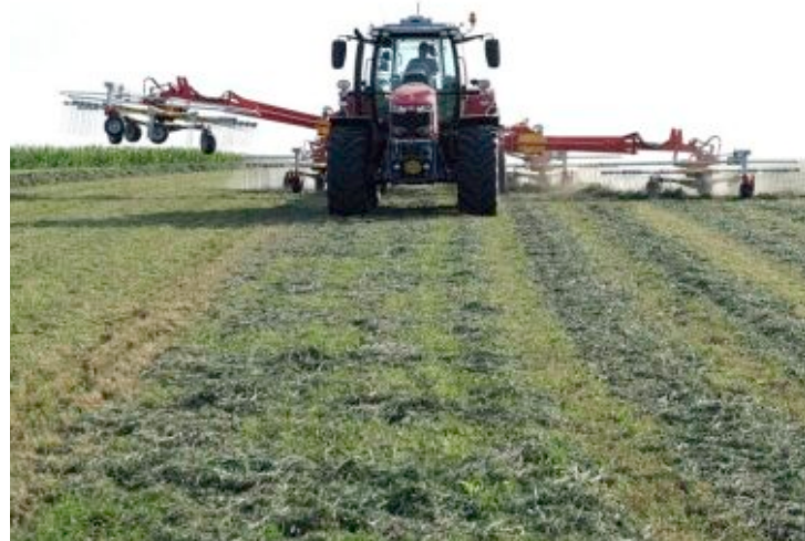
Das linke Bild zeigt die Folgen eines zu spät abgesenkten hinteren Kreisels. Der Schwad im Vordergrund ist nicht exakt gearbeitet. Rechts ist zu sehen, wie sich unnötige Doppelbearbeitung vermeiden lässt.

deutlich verbessert hat. Wird zusätzlich noch die gespeicherte Aushubhöhe der Kreisel an die Höhe des Schwads angepasst, kann man nochmals etwas Zeit gewinnen.