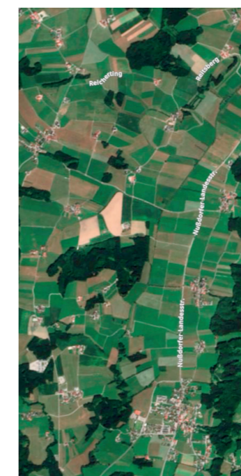
Das Flächenmonitoringsystem könnte man auch dazu nutzen, um Betriebe zu motivieren.

Bei der Durchführung von Kontrollen und Erhebung von gesetzlichen Rahmenbedingungen entstehen große Daten-