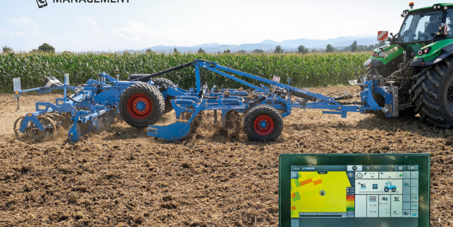
In dem Versuch wurden Auswirkungen auf die Flächenleistung und den Kraftstoffbedarf durch eine variable Arbeitstiefe untersucht.