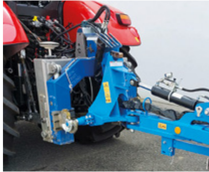
Die Applikationskarte basiert auf Kraftmessungen bei der Stoppelbearbeitung.

Die Steuerung erfolgt über den ISO-Bus-Baustein TIM (Tractor Implement Management). TIM basiert auf der ISO-Bus Klasse III, dem aktuell höchsten ISO-Bus-Standard. Um diese Funktion zu nutzen, müssen Traktor, Terminal und das Gerät TIM-zertifiziert sein. Eine Auflistung der zertifizierten Geräte und Maschinen finden Sie in der AEF-Datenbank