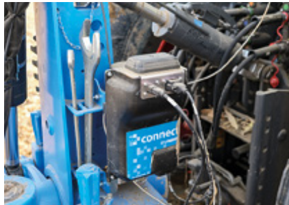
iQblue connect kann sowohl auf dem Grubber als auch am Pflug zum Einsatz kommen.

im Internet unter aef-isobus-database.org . Aber Achtung: Die Zertifizierungen können unterschiedliche Funktionen beinhalten: Manche Traktoren können z.B. das Hubwerk über TIM ansteuern – für die Karat-Steuerung notwendig – andere nicht. Zusätzlich zu den genannten Komponenten und Zertifizierungen muss ein GNSS-System zur Verfügung stehen; vornehmlich mit RTK-Genauigkeit.