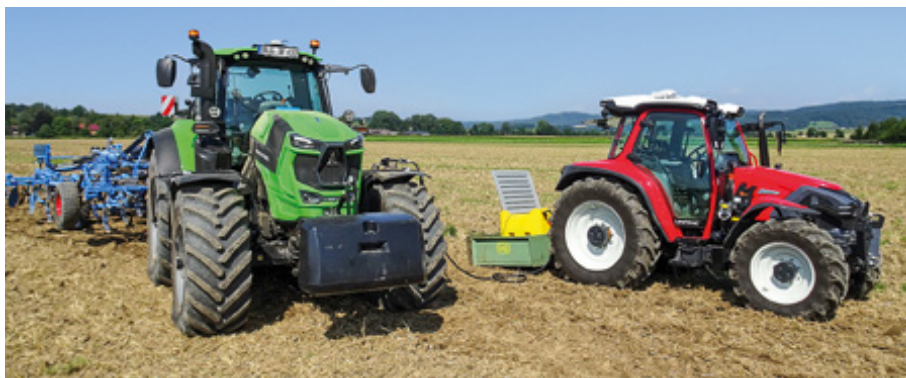
Nach jeder Wiederholung wurde der Kraftstoff nachgetankt und der spezifische Versuch entsprechend festgehalten.

Auf dieses Verfahren stützt die Innovation Farm ihre Messergebnisse. Beim Stoppelsturz mit dem Karat wurde der Kraftbedarf aufgezeichnet. Der Arbeitsgang erfolgte mit einer konstanten Arbeitstiefe der Flügel-schare von 8 cm. Zur Erfassung des Zugkraftbedarfs nutzte das Team einen Dreipunkt-Messrahmen zwischen Traktor und Grubber.