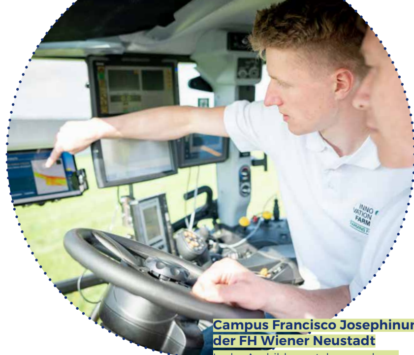
Campus Francisco Josephinum der FH Wiener Neustadt In der Ausbildung stehen moderne Landmaschinen zur Verfügung.