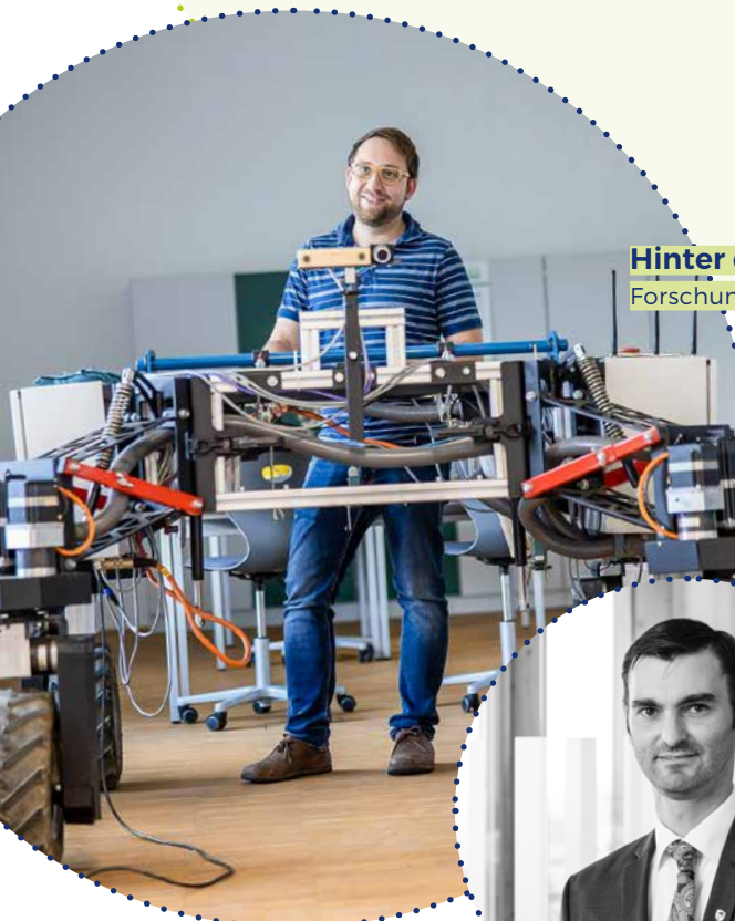
Hinter den Kulissen: Forschung auf höchstem Niveau